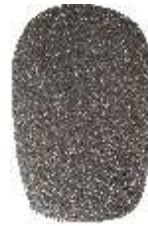
海绵防风罩 随供附件