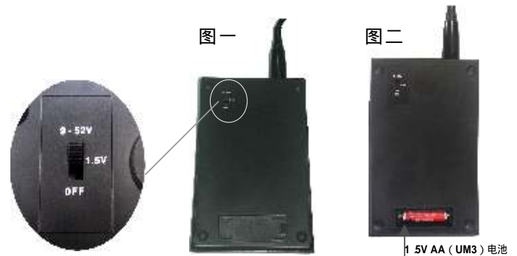
1.5V AA (UM3) 电池