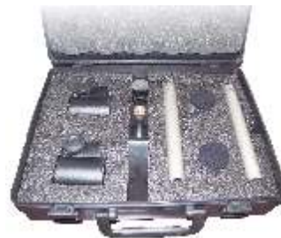
随供附件 S -08泡沫防风罩