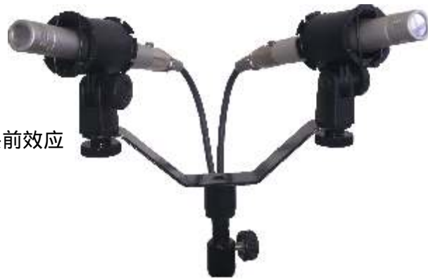
CM -H8K 心形指向性