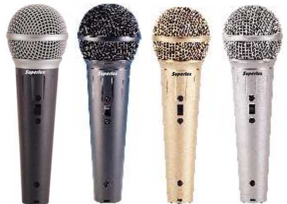
D103/02 D103/01 D103/49 D103/13