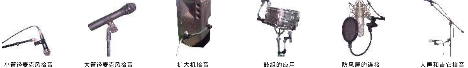
小管径麦克风拾音