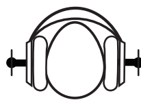
相同隔音效果 夾力較小