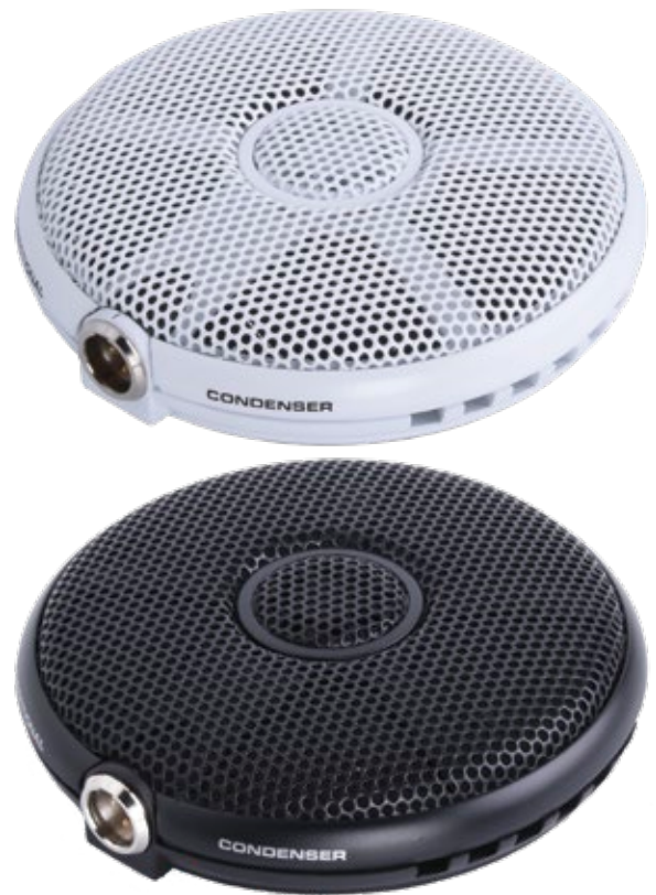
E304 Frequenzumfang (Kugel)